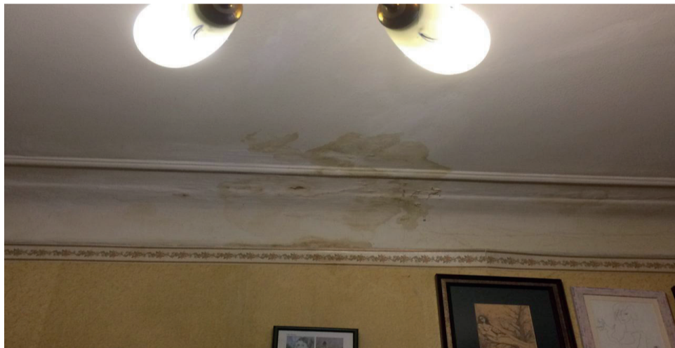
Желтеющие потолки и сырость – в таких условиях жить нельзя никому, тем более ветерану Великой Отечественной войны. Фото: Фёдор Фирсов

Пресс-служба Тамбовского регионального отделения ЛДПР