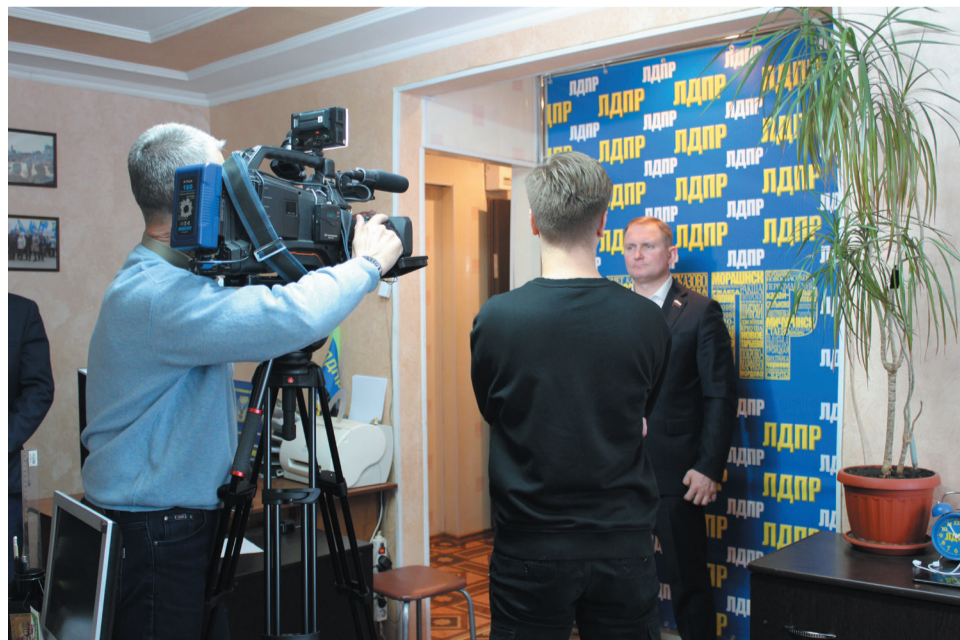
Чтобы власть обратила внимание на конкретные ситуации, ЛДПР освещает острые вопросы на телевидении

Пресс-служба Тамбовского регионального отделения ЛДПР