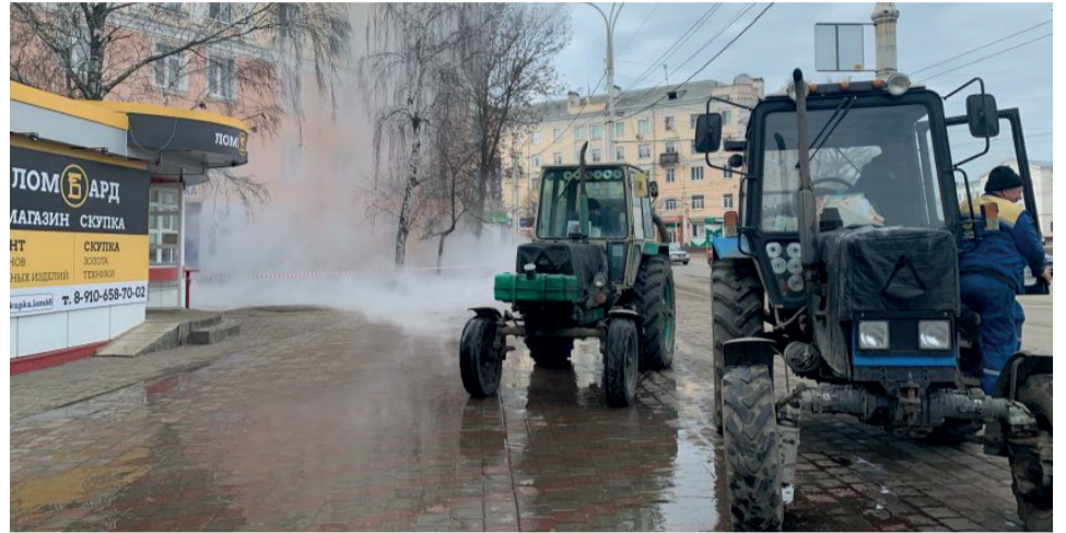
Сырая брусчатка и фонтанирующая из-под земли пар. Значит, часть тамбовчан снова осталась без горячей воды.

Чтобы защитить свои права, любому гражданину, не только ветеранам Великой Отечественной войны, приходится пройти через все круги бюрократического ада. Десятки кабинетов, сотни справок, тысячи печатей – и не важно, нужно ли вам получить законный ремонт жилья или же выбить из чиновников маленькую льготу.