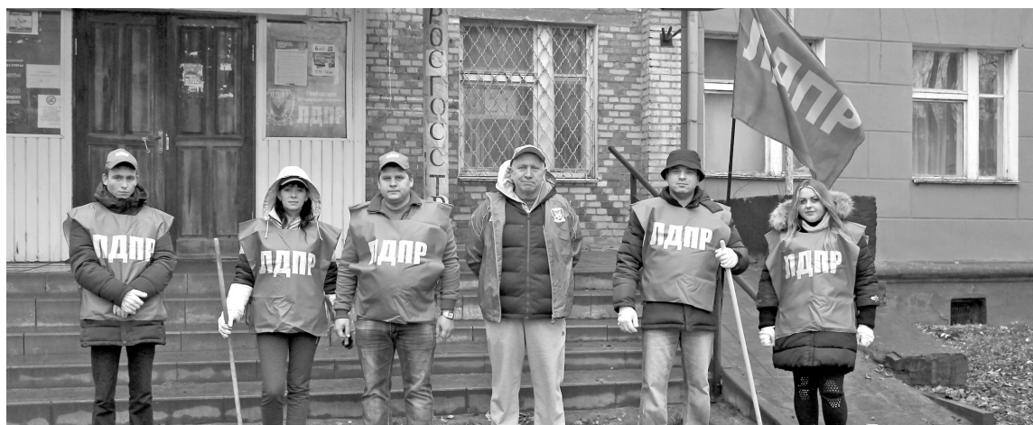
Координатор регионального отделения вышел на уборку вместе с активистами

В выходной день представители Тамбовского городского местного отделения ЛДПР по собственной инициативе вышли на субботник. Активисты приняли решение провести уборку у здания по адресу Мичуринская, 50А. Трудолюбивые люди взяли весь необходимый для работы инвентарь, включая лопаты,