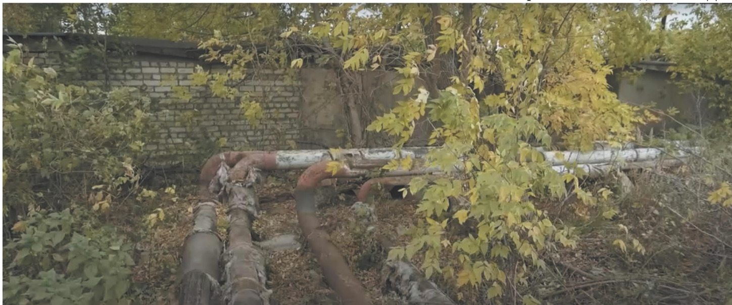
Так выглядит теплотрасса на Астраханской улице. Ржавые трубы, лишённые теплоизоляции, стыдливо прячутся в зарослях за гаражами

Пресс-служба Тамбовского регионального отделения ЛДПР