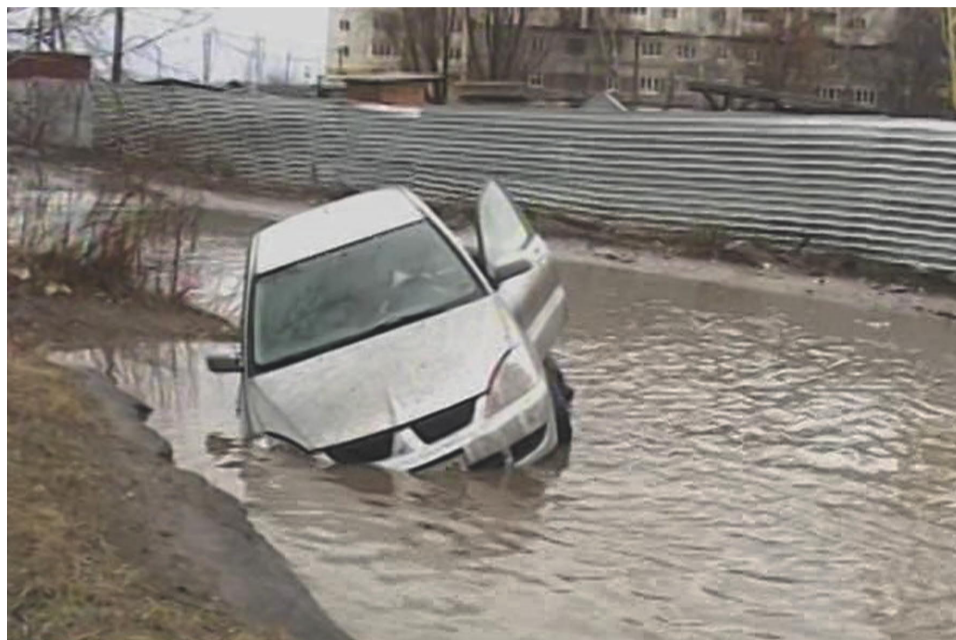
Без лодки по тамбовским дворам лучше не ездить — никогда не знаешь, где машина пойдёт ко дну.

То, что в Тамбове далеко не в каждом дворе можно найти современную детскую площадку или спортивный комплекс, никого не удивляет. Однако многие дворы района МЖК не то что не благоустроены, но не имеют даже освещения! Ночью путь до подъезда превращается в тропу для экстрималов. В темноте легко не заметить дыру в асфальте под ногами, или вымочить ноги в лужах, а с приходом холодов серьёзно вырос шанс поскользнуться на углу дома, где обычно с крыши или водостока стекает вода и замерзает. Такие падения часто заканчиваются не только ушибами, но и серьёзными переломами.