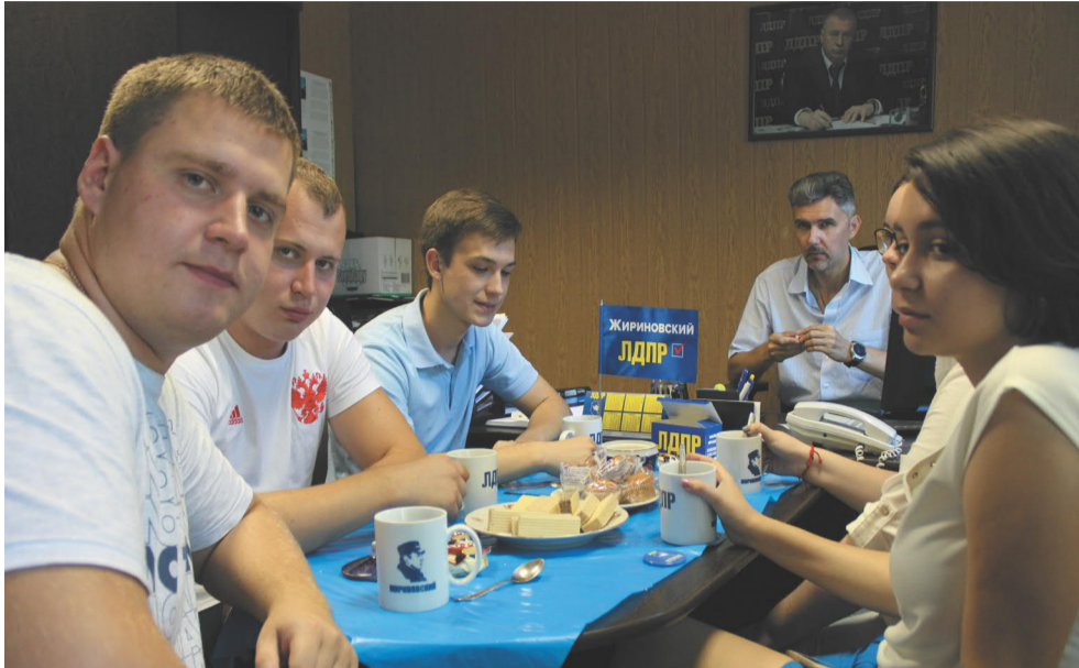
Заседания молодежной организации не проходят в строгих формальных условиях; главное – дружеская атмосфера и хорошее настроение