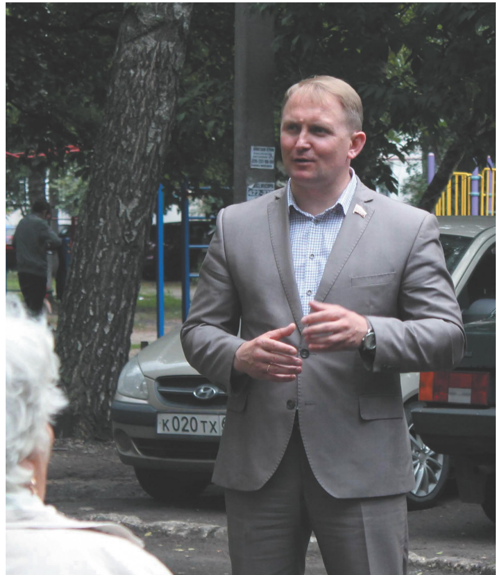
Депутат Государственной Думы фракции ЛДПР Александр Шерин общается с тамбовчанами